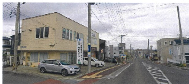
南光台四条通面す