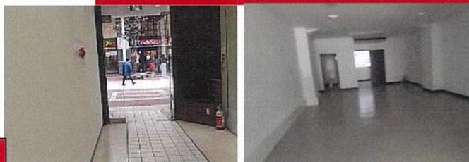
1階店舗の内部写真