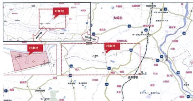
大崎市鹿島台大迫字下志田592-1・592-2 計1877.41㎡約568坪位置図