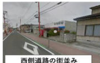
西側道路の街並み