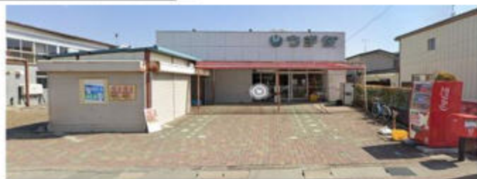
西側道路からの外観